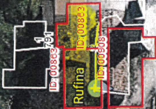
Chiesa di Santa Rufina